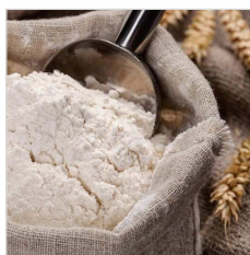
Obilí a mouka