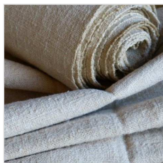
Látky (lněné plátno)