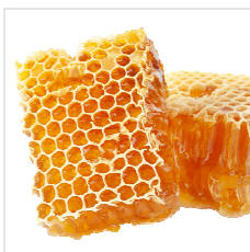
Med a vosk