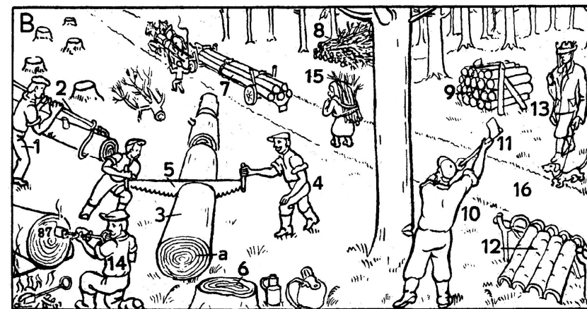
U dřevorubců *