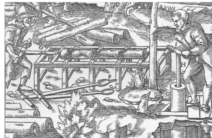
Trubař při práci, Georgius Agricola, Bergarchiv Freiberg

Ahoj sousede. Hallo Nachbar. Interreg V A / 2014 – 2020