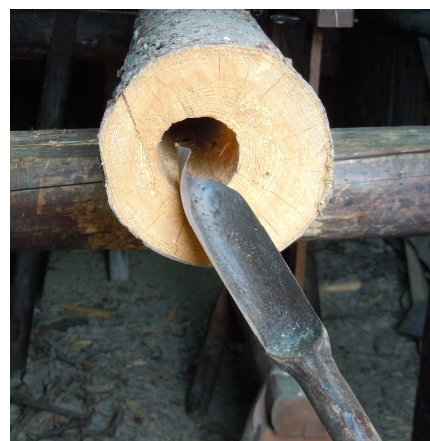
Vodovodní trubka a lžicový vrták

K výrobě takovýchto trubek se na nosnou konstrukci řetězem připevnilly rovně rostlé kmeny stromů, dlouhé asi 3 m s průměrem 12 až 18 cm. Střed kmenů sloužil k seřízení a orientaci. Šnekovým vrtákem podepřeným o kozlík se zpravidla provedlo jen několik otáček. Vrták se pak vytáhl, odebraly se vzniklé spirálovité třísky (Dudel) a zkontrolovalo se vycentrování vyvrtaného otvoru. Následně se ve vrtacích pracích pokračovalo. Vrty probíhaly z obou stran až do středu, přičemž se musely přesně sejít. Dřevěná vodovodní potrubí tohoto druhu vydržela v závislosti na kvalitě půdy několik desetiletí.